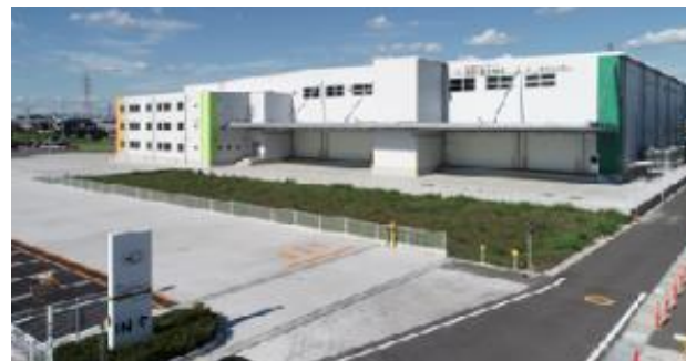
スリーエス物流 第3物流センター 住所: 愛知県一宮市