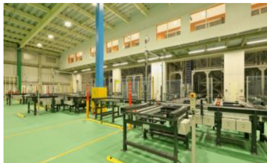
エスラインジフ 飲料自動倉庫 住所: 岐阜県羽島郡岐南町