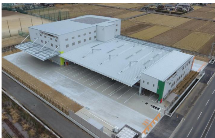
＜施設外観 上空より＞