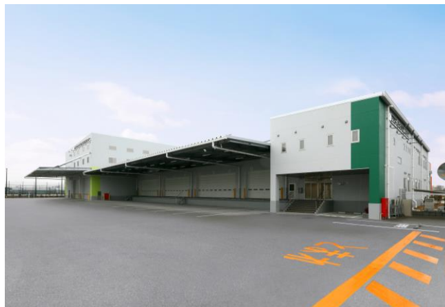
＜施設外観 南側より＞